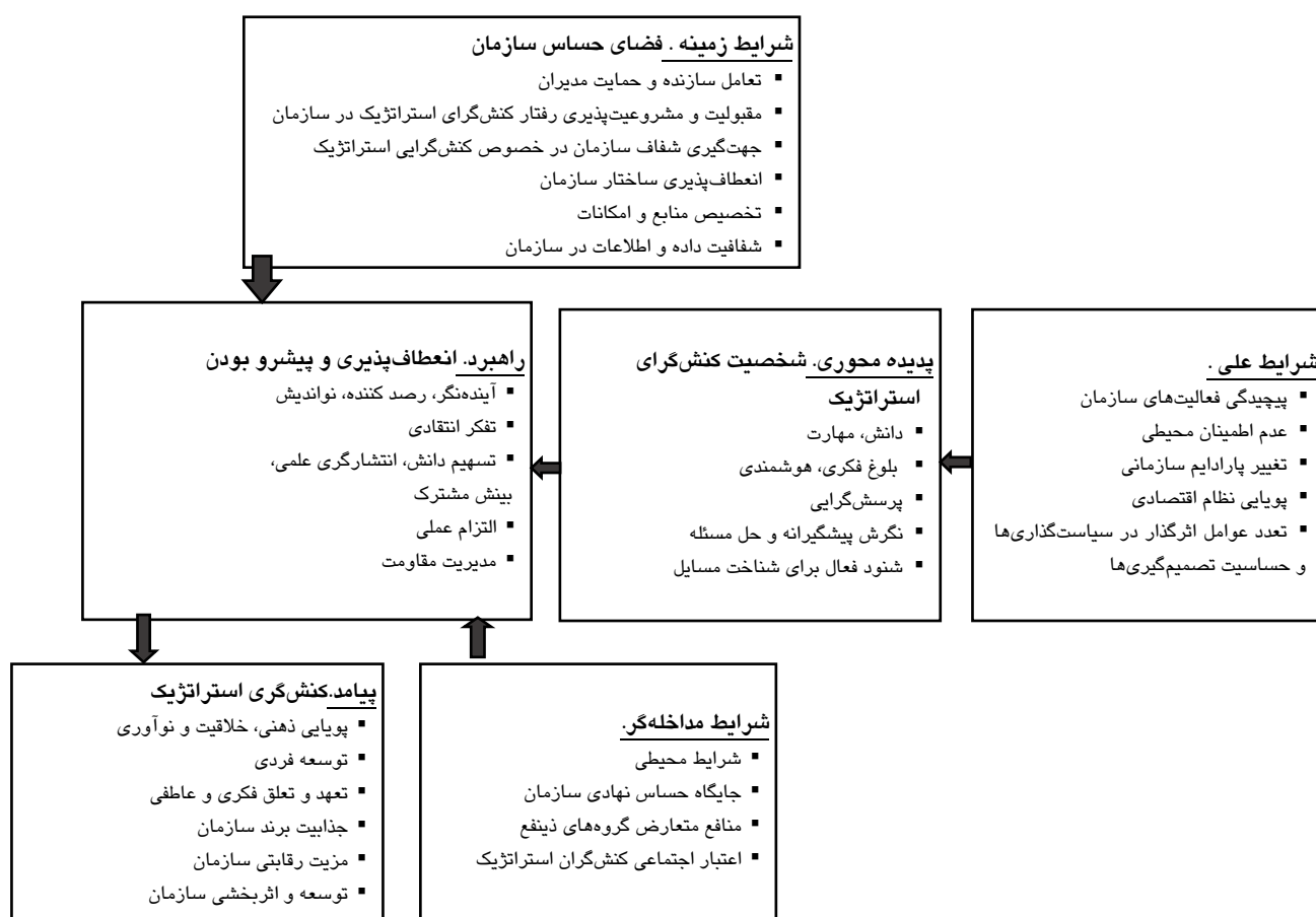
شکل ۱. الگوی پارادایم رفتار کنش‌گرای استراتژیک کارکنان

استراتژیک عبارت‌اند از رفتارهایی که با واکاوی استراتژیک، تولید ایده‌های نوین و فراهم‌سازی بسترهای لازم برای پیاده‌سازی آنها در پی ایجاد تغییر در استراتژی‌های سازمان به‌منظور همراستایی، مقابله و یا تناسب با محیط خارجی هستند و سعی در افزایش اثربخشی عملکرد خود و سازمان دارند [ ۶۶۲-۶۳۳: ۱۴]». بنابراین مفاهیم و ارتباط عناصر مدل رفتار کنش‌گرای استراتژیک در سازمان در پرتو این تعریف طراحی و سازماندهی شده است. همچنین از سویی، سازمان مورد مطالعه یک سازمان حاکمیتی در سطح محیط ملی و بین‌المللی کشور است و از سوی دیگر افراد منتخب در سازمان کنش‌گران کلیدی و استراتژیک در ساختار سازمان محسوب می‌شوند، تجربه‌ها، مصادیق و مباحث ارائه شده توسط ایشان عملکرد معمول و سازمانی و تخصصی ساده نبوده، بلکه رفتار متفاوت و استراتژیک است و نتایج حاصل نیز برای فرد و سازمان تعیین‌کننده بوده است. بنابراین ماحصل این‌گونه رفتار، پدیده محوری که توسط افراد کنش‌گر استراتژیک رخ می‌دهد و پیامدهای حاصل آن، هم‌معنا با تعریف رفتار کنش‌گرای استراتژیک است. چارچوب مدل نیز بر این اساس کدگذاری، مفهوم‌سازی و طراحی شده است.