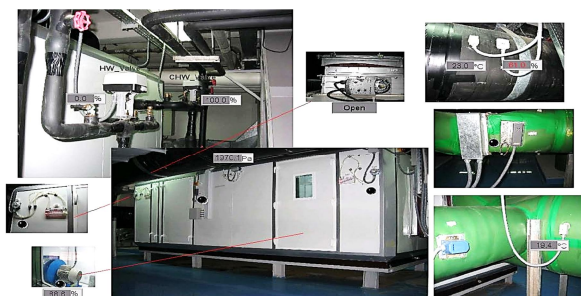
Fig. 2 AHU of clean room

هواساز مدل شده در این پژوهش دارای زیر سیستم‌های، کویل سرد و گرم، فن هوای رفت و رطوبت‌زن، "شکل 2"، که رفتار کویل سرد و گرم را به روش جعبه خاکستری و رطوبت‌زن و فن به شیوه جعبه سفید شبیه‌سازی شده‌اند.