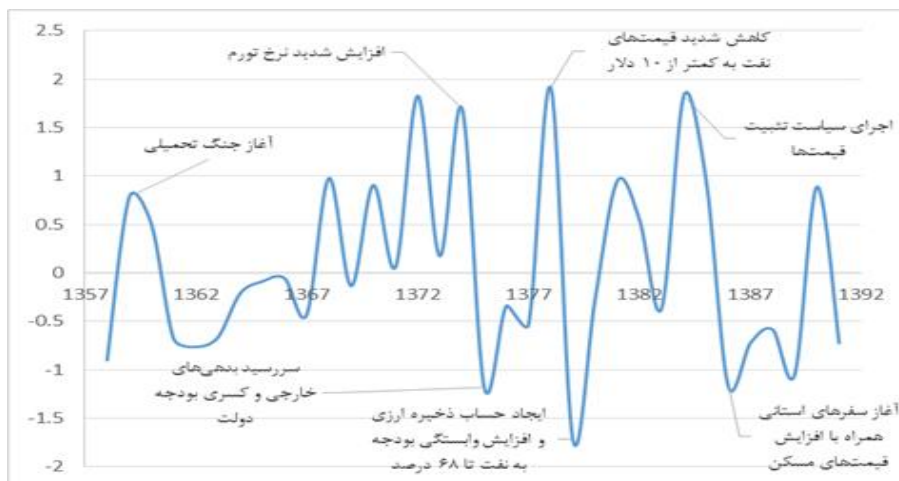
نمودار ۱. روند نااطمینانی نسبت به هزینه‌های دولت

پس از برآورد معادلات (۶) و (۷)، می‌توان با ایجاد سری جملات باقیمانده معادله (۶)، متغیر نااطمینانی نسبت به هزینه‌های دولت را تولید کرد. بنابراین، داده‌های این سری می‌توانند به عنوان نماینده‌ای از عدم اطمینان نسبت به هزینه‌های دولت باشند. در نمودار (۱) روند نااطمینانی نسبت به هزینه‌های دولت رسم شده است.